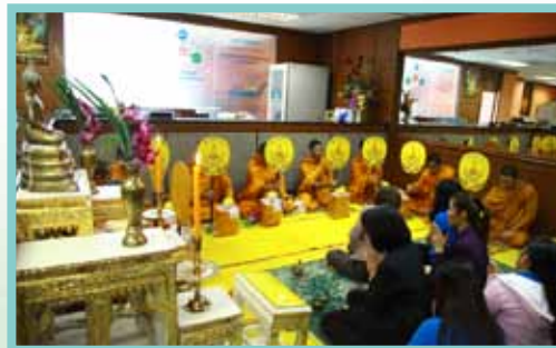
ทำบุญ สอ.ทอท. ครบรอบ 26 ปี เมื่อวันที่ 17 กันยายน 2556