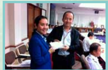
สอ.ทอท. พบสมาชิก ทำอากาศยานหาดใหญ่ เมื่อวันที่ 20-21 มกราคม 2557