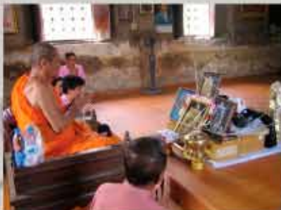
หลวงพ่อเฉลิม วัดพระญาติธรรม จ.อุบลราชธานี