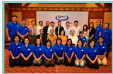
โครงการสัมมนา “การบริหารงานสหกรณ์ออมทรัพย์” เมื่อวันที่ 7-9 มิถุนายน 2556