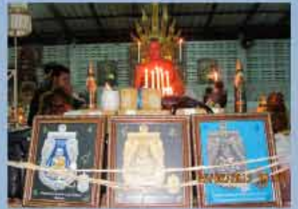
พระอาจารย์จวบ วัดสุทนต์ จ.ปัตตานี