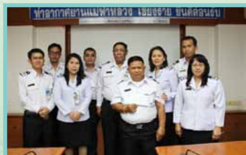
สอ.ทอท. มอบทุนการศึกษาบุตรสมาชิก ประจำปี 2556