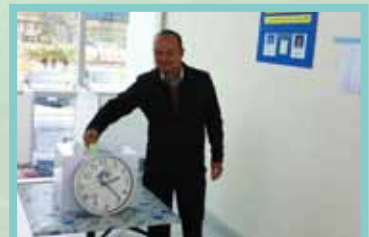
การเลือกสรรคณะกรรมการ สอ.ทอท. ประจำปี 2557 เมื่อวันที่ 22 มกราคม 2557