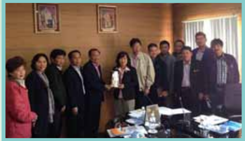
เยี่ยมชมกิจการ สหกรณ์ออมทรัพย์ครูเชียงราย จำกัด เมื่อวันที่ 19 ธันวาคม 2556