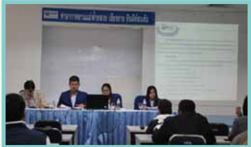
สอ.ทอท. พบสมาชิก ทำอากาศยานแม่ฟ้าหลวง เชียงราย เมื่อวันที่ 19-20 ธันวาคม 2556