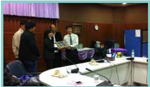
เยี่ยมชมกิจการ สหกรณ์ออมทรัพย์มหาวิทยาลัยสงขลานครินทร์ จำกัด เมื่อวันที่ 20 มกราคม 2557