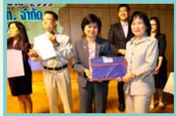
การประชุมใหญ่สามัญประจำปี 2555 สหกรณ์ออมทรัพย์บริษัท ท่าอากาศยานไทย จำกัด เมื่อวันที่ 14 กุมภาพันธ์ 2556