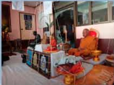
พ่อท่านเอียด วัดวิเวกฯ จ.ปัตตานี

เนื้อทองแดงรมมันปู บูชาองค์ละ 99.- บาท ได้ที่ ฝ่ายการเงิน บมจ. ท่าอากาศยานไทย