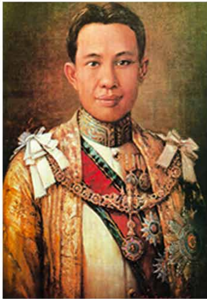
พระราชวรวงศ์เธอ กรมหมื่นพิทยาลงกรณ์ พระบิดาแห่งการสหกรณ์ไทย