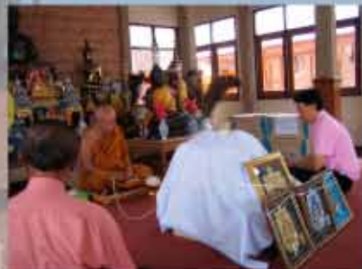
หลวงพ่อคุณ วัดโพธิ์ไทรธรรม จ.อุบลราชธานี

ประชาสัมพันธ์โดย สมาคมสโมสรท่าอากาศยาน https://th-th.facebook.com/aot.airport.club